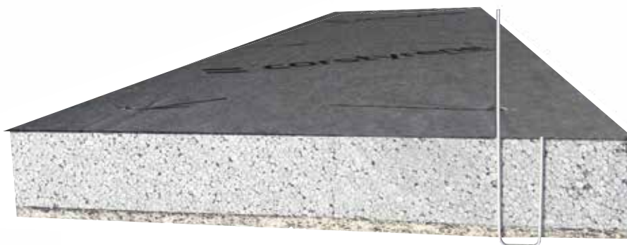
Schéma d'agrafage (voir fiche Technique)